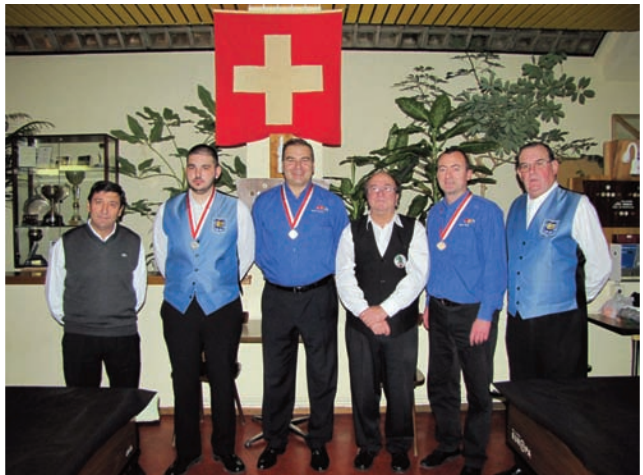
Finale 3 Bandes LNB