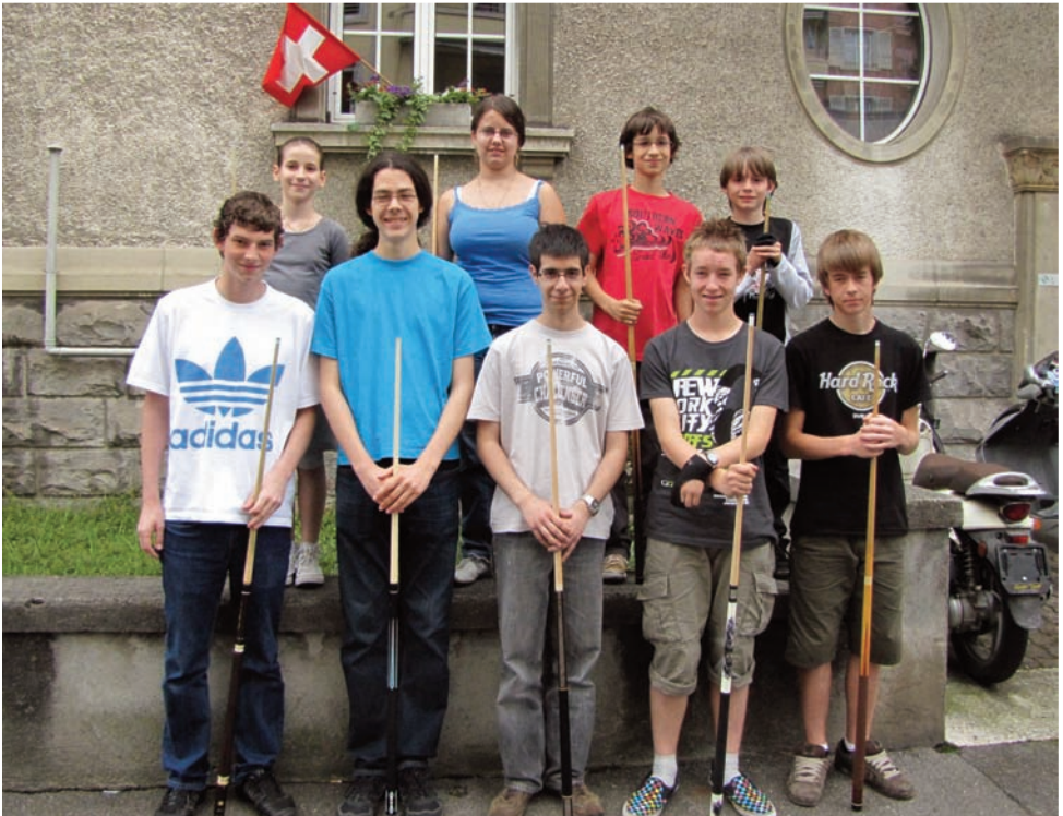
Le Tournoi du Léman 2010 - ALB le 19 juin